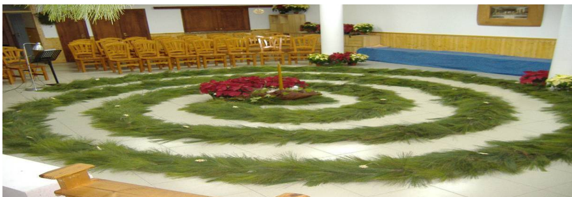
Espiral del jardín del Adviento

Un año más tenemos la posibilidad de andar el camino, de mantener prendida la llama que iluminará el recorrido y que junto a las demás dará dirección y sentido a nuestro deambular. Y es que este mes, el de noviembre, nos invita desde su inicio con la fiesta de Todos los Santos a reencontrarnos con nosotros mismos, con la esencia de nuestro ser, a buscar en nuestro interior la llama que portaremos en nuestro farol con pasión y que al final de mes podremos depositar en La Espiral con la que iniciamos el tiempo del Adviento.