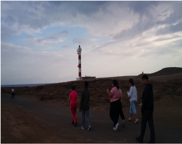
En el Faro del Porís

Gracias a las familias por el apoyo para que estas actividades puedan ser realizadas. A continuación fotos de los encuentros: