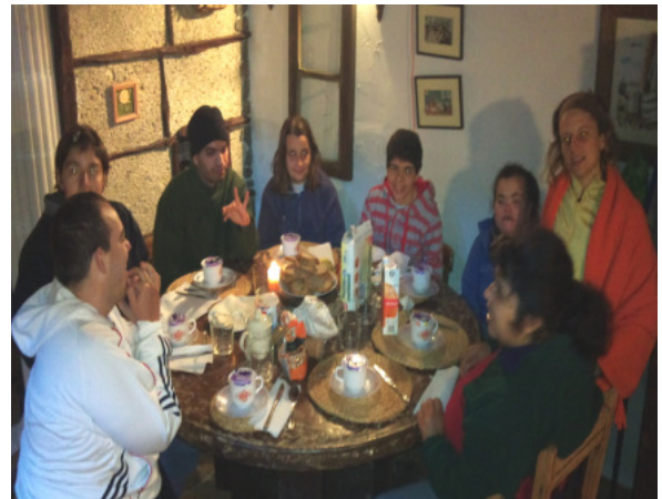
Con amigos en Santiago del Teide