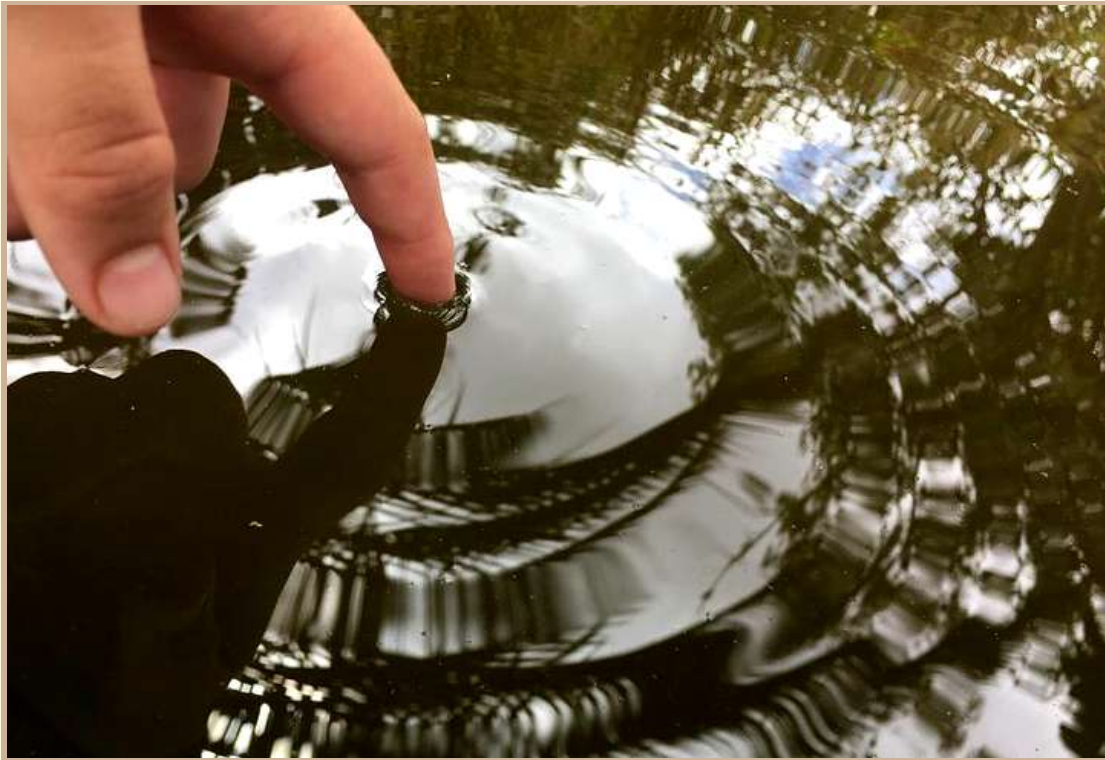
Centro de Pedagogía Curativa y Terapia Social San Juan.

Nuestras puertas se abren a los más pequeños con la ilusión de crear espacios y oportunidades que preserven lo más preciado que tenemos, el germen de la humanidad, el germen que hará posible la sana convivencia, el trabajo del encuentro con unos y otros, sumando desde las diferencias y similitudes, aprendiendo de las relaciones, con confianza plena en el buen hacer. Aprendiendo cada día de estas nuevas experiencias que se generan, con la visión que nos lleve hacia la evolución individual y personal, promoviendo el pensamiento crítico, los actos nobles y el amor presente en cada detalle, donde se cree el espacio para reconocer al yo, al tú y descubrir un nosotros. Generando el contacto con lo auténtico que nos regala la tierra desde el reconocimiento, respeto y compromiso.