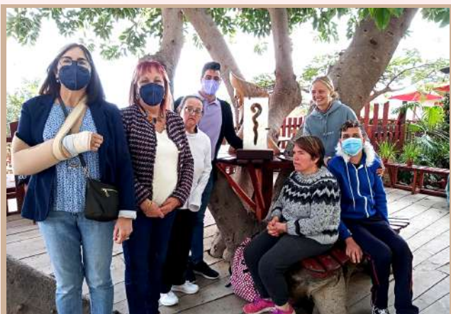
Centro de Pedagogía Curativa y Terapia Social San Juan.