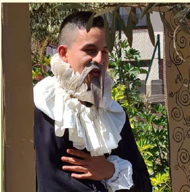
Centro de Pedagogía Curativa y Terapia Social San Juan.