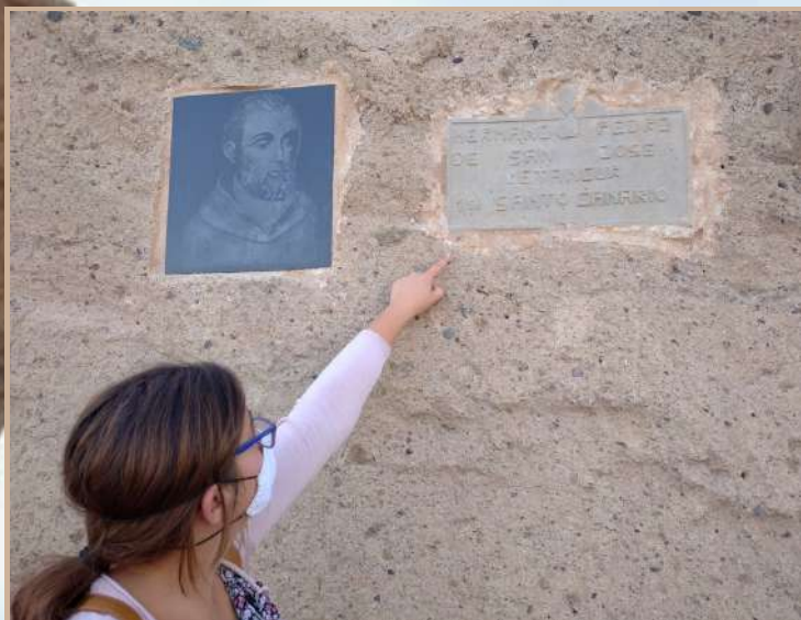
Centro de Pedagogía Curativa y Terapia Social San Juan.

Pedro de San José de Betancur nace en Vilaflor el 21 de Marzo de 1626, su familia no poseía dinero, eran de abolengo pero de pocos recursos. Su padre tenía tierras y cabras. La niñez de Pedro transcurrió en el pequeño pueblo de Vilaflor, tranquilo y alejado del mundo. Era un niño modesto, callado pero de constitución fuerte para los trabajos del campo. Desde muy pequeño tuvo predilección por las cosas de Dios, orando todo el tiempo, incluso cuando estaba en el campo cuidando del rebaño de cabras de su padre. De su vida en Tenerife existen algunas anécdotas, como que permanecía grandes temporadas en la famosa cueva que lleva su nombre, situada en el Médano, al sur de la isla. La utilizaba Pedro como refugio para su ganado durante el invierno, como lugar de oración e incluso como escondite para resguardarse de los piratas, tan abundantes en las costas canarias en aquella época.