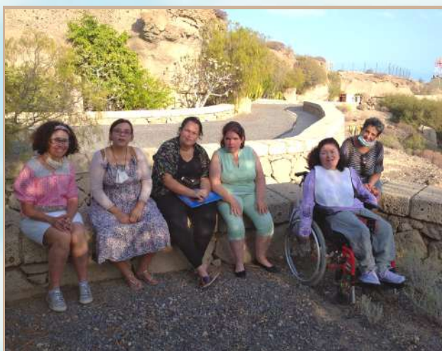
Centro de Pedagogía Curativa y Terapia Social San Juan.