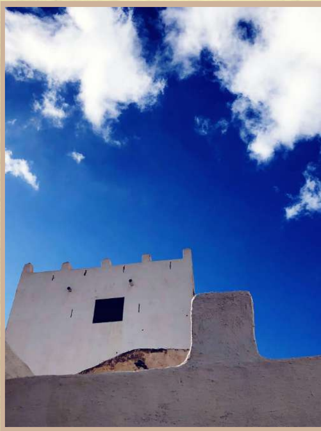
Centro de Pedagogía Curativa y Terapia Social San Juan.

La Casa Fuerte es un ícono arquitectónico de nuestro pueblo, al que nos sentimos muy motivados en apoyar en su nueva andadura. Además de ser vecinos, ponemos en valor su interés por recuperar la memoria e historia de nuestro lugar. Por rescatar y resignificar un trozo del desarrollo de esta comunidad y presentarlo con las puertas abiertas. Ofreciendo la posibilidad de acercarnos a conocer el legado y costumbres del lugar y sus gentes. La arquitectura al descubierto, es muy bonita e impactante. Parece que sus inmensas paredes nos hablan, nos cuentan, desde un silencio con eco, desde la temperatura húmeda que emanan. Se propone al visitante un sorprendente recorrido por sus patios y sus ambientes. Esta ventana que se abre en el corazón de Adeje nos hizo partícipes para acompañarles y recibir a los adejeros que llegaron hasta allí. Coincidiendo con el Domingo de Ramos, con los ramitos de olivo bendecidos, al terminar la misa, comenzaron a llegar. Se creó un ambiente muy cálido, en el