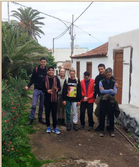
Centro de Pedagogía Curativa y Terapia Social San Juan.

El nombre de este barrio nos recuerda que, en su día, tras la conquista de 1496 disponía de abundante agua dulce; por ello fue un lugar usado para la agricultura, en especial de la caña dulce. A finales del siglo XV se produjo la apertura del Camino Real que uniría la Rambla de Castro con Icod, y que facilitaría nuevas formas de explotación económica que demandaban la unión de las poblaciones costeras y sus recursos. Si te preguntas qué era un Camino Real, fueron todos aquellos caminos construidos por el Estado, más anchos de lo común y que unían poblaciones importantes, ayudando así a transportar mercancías. El sendero de Las Aguas también fue precisamente uno de estos caminos que permitía la comunicación con el Puerto de la Cruz. A lo largo del recorrido había algunos caseríos, unos pocos se han conservado y reconvertido para acoger actividades de turismo rural. La más conocida es la casa El Cura , que posee unas hermosas vistas al mar; allí vivió durante muchos años el párroco del lugar. Aunque quizás una de las casas que más nos sorprendió fue una de pequeño tamaño que convivía con una enorme roca con la que se mimetizaba.