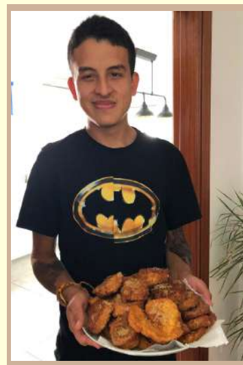
Centro de Pedagogía Curativa y Terapia Social San Juan.