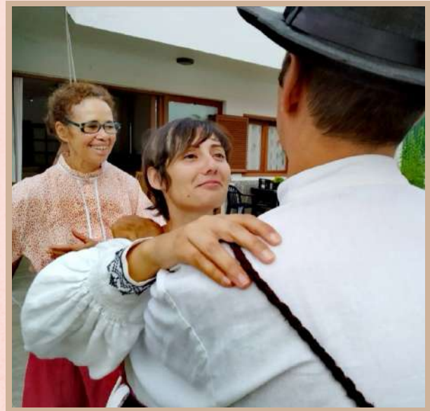
Centro de Pedagogía Curativa y Terapia Social San Juan.