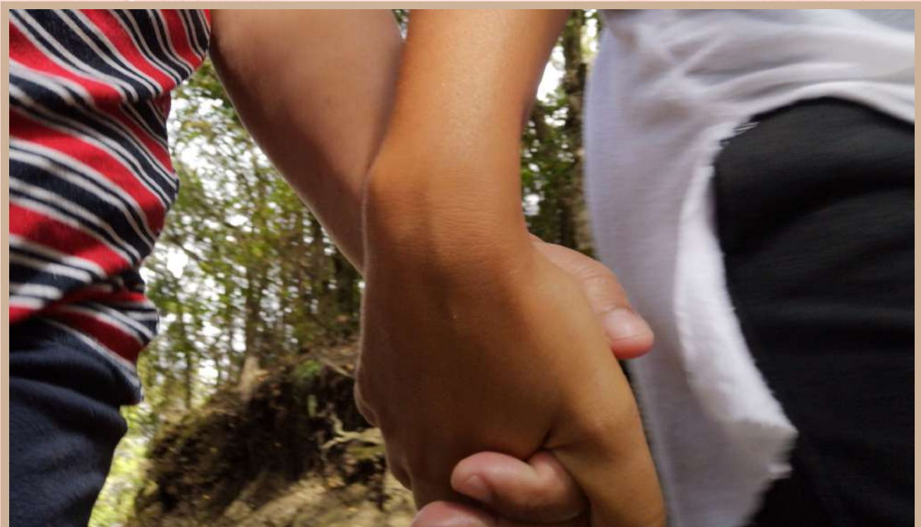
Centro de Pedagogía Curativa y Terapia Social San Juan.

La lucha de las familias por hacer que San Juan perdure se pone de manifiesto cada día, aunque no es indiferente para nadie que hay un reto pendiente y es poder establecer raíces en un espacio físico donde el ser San Juan pueda seguir brillando con luz propia sin incertidumbres, pudiendo acoger cada día a niños, adolescentes y adultos con y sin necesidades especiales, porque de esto se trata: de ser una comunidad que tome como base la inclusión.