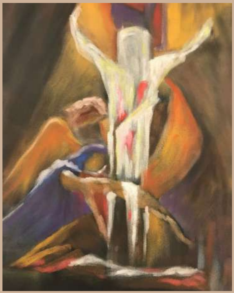
Pintura de Fidel Ortega Dueñas. Año 2022.

Finalizado el Carnaval nos introducimos en el tiempo de Cuaresma, periodo que concluye en la Semana Santa. En nuestra cultura siguen muy latentes los rituales cristianos en la representación del drama de la pasión de Cristo. La importancia de la última cena de Jesús, el mandamiento que nos deja “Como yo os he amado, amaos también unos a otros” . Las humillaciones, los flagelos y su crucifixión que se reviven representadas cada Viernes Santo. La fe de María velando el sábado, la Resurrección de Cristo que redime nuestros pecados, el Domingo de Pascua con ese amor con mayúsculas que todo lo puede. Y ese mensaje plasmado en el tiempo: “Jesús nos ha abierto la posibilidad de vivir una vida plena, reconciliada y eterna” . Es algo muy implantado en nuestro cristianismo.