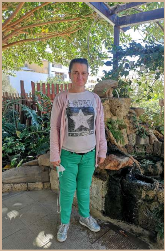
Centro de Pedagogía Curativa y Terapia Social San Juan.